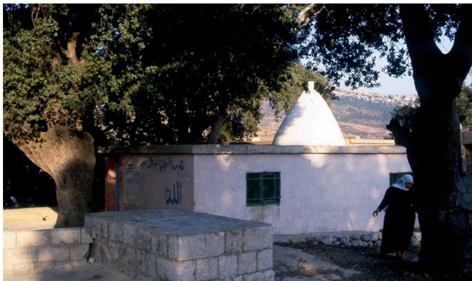
למעלה: מקום קדוש: שיח' עות'מן אלחזורי