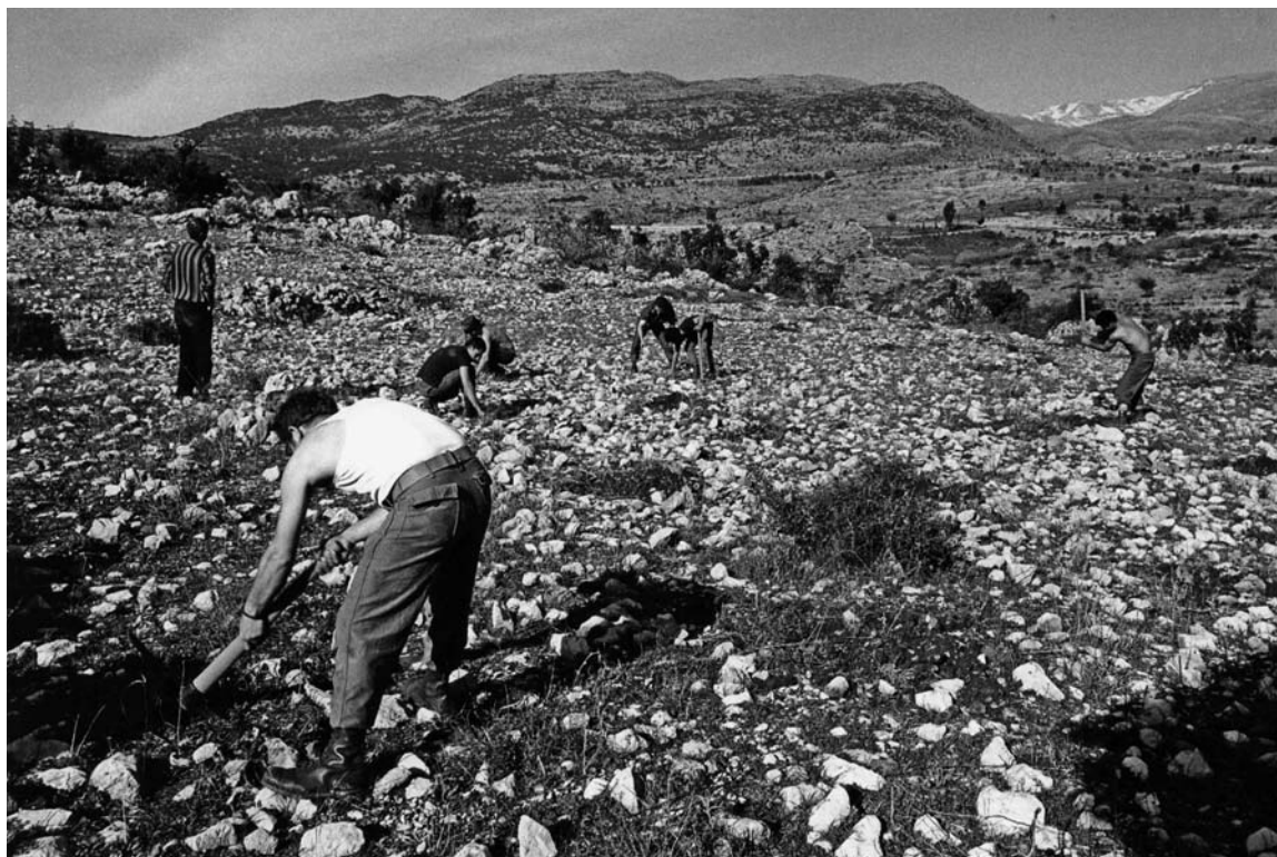
טקס הנטיעות

מהחיילים. שבילי חציץ, תחומים באבני המקום, מובילים אל שלושים ואחת פינות ההתייחדות החבויות בעיקולי הגבעה). חורשת הזיתים שהייתה במקום שומרה, ולמרגלותיה נבנה מעין אמפיתאטרון טבעי העוקב אחר הטופוגרפיה ומשקיף על קלעת-נמרוד. לשלושים ואחת הפינות המקוריות ('אגוז הישנה') נוספו לימים עוד עשרים ושש פינות הנצחה ('אגוז החדשה').