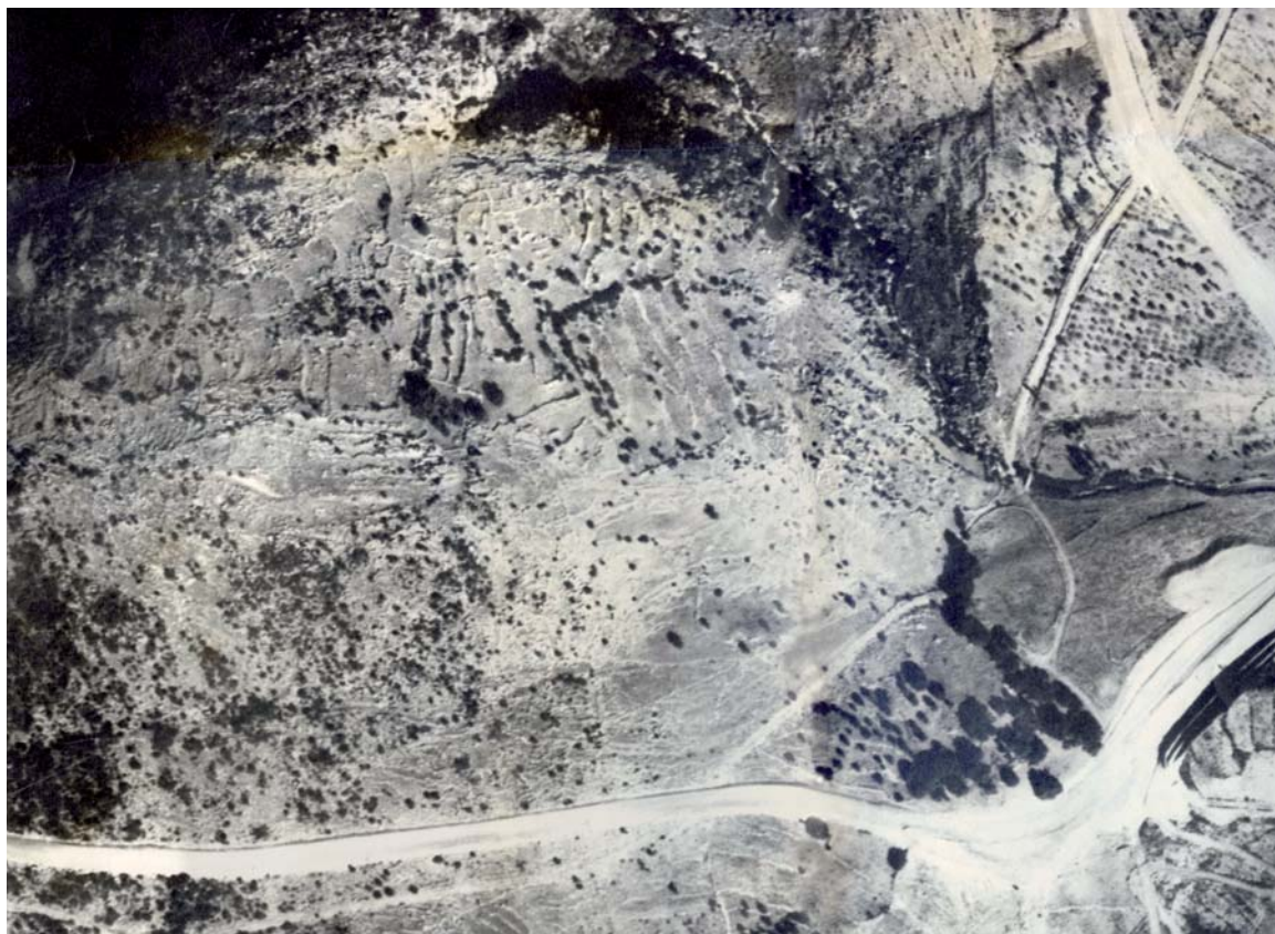
גבעה 833 (תצלום אוויר, מסמכי התחרות,)