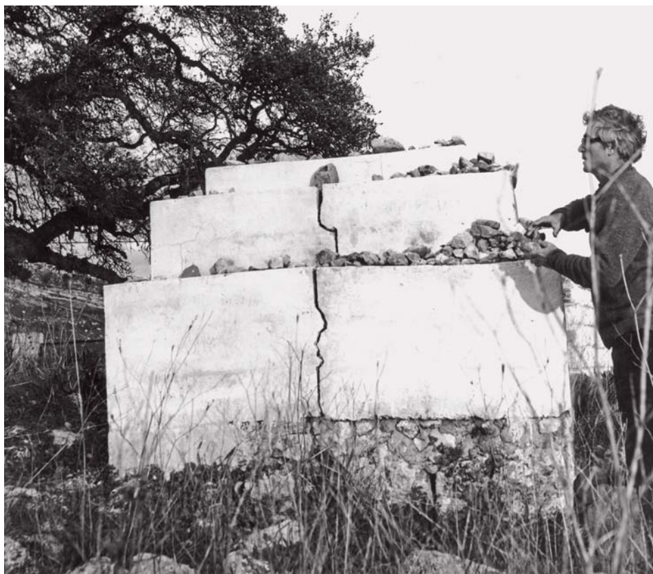
למטה: י' דנציגר וקבר אבא חלפתא