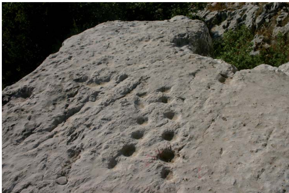
מימין: 'סלע הפולחן' למטה: 'כל סטרוקטורה וורטיקאלית לא תוכל לעמוד בתחרות עם הרבס'