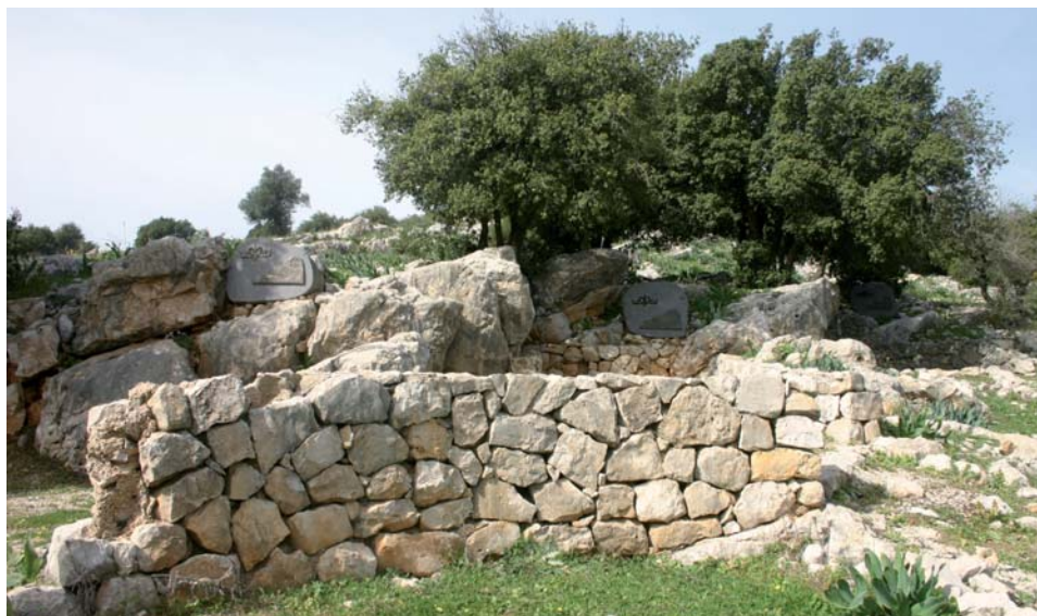
פינות הנצחה אישיות

שרה בריטברג-סמל תיארה את דנציגר 'האמן הישראלי היחיד עד היום [1976] שהייתה לו שמיעה אבסולוטית לטבע'. 27 בשיחה עמה הוא אמר: