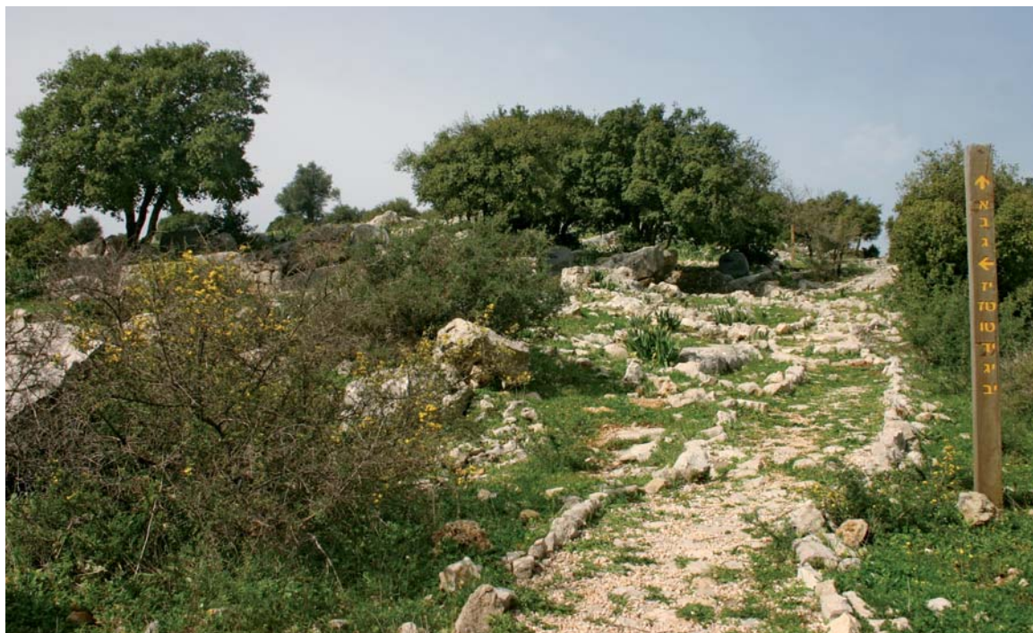
שבילים לפינות ההנצחה

רץ הציע לשתול עצים ושיחים הדורשים השקיה ובמקביל לטפח את החורש הטבעי. תכנית הצמחייה שהכין כללה מקבצים של עצים מצלים, כמו ארז ואורן (הגלעין וירושלמי), עצים פורחים, כמו כליל החורש, ובפינות ההנצחה צמחייה נמוכה של שיחים, כמו אלת המסטיק, אחירותם ורוזמרין, שיבדילו ויבליטו את הפינות הללו מסביבתן החשופה מבלי להסתיר את הנוף הנשקף מהן. רץ הציע גם לנטוע מעין בוסתנים ייחודיים של עצי פרי, כמו דוברבן, בוטנה ושקד, ולעודד טיפול נופי יחידי של בני המשפחה בפינות האישיות. 25