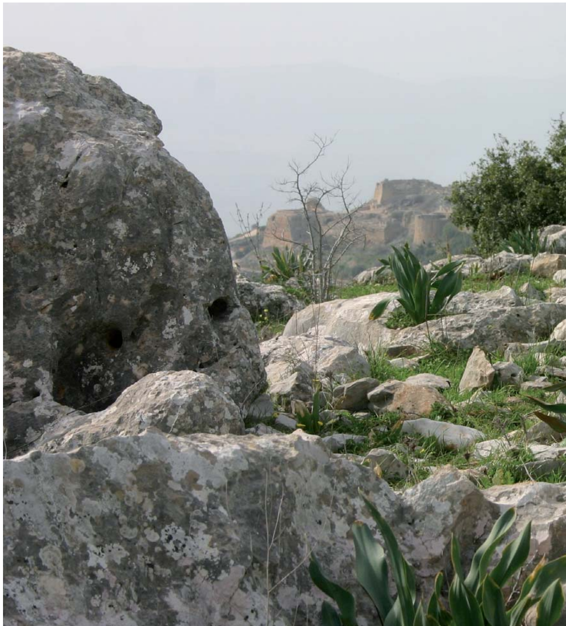
ההיסטוריה והארכיאולוגיה של מקום הן חלק מהנוף'

זיקתו לנוף הארץ, היותו בבחינת מבנה ארכיטקטוני טעון, מיקומו המיוחד ביחס לשמש, טקסים הקשורים בו, כמו קשירת בדים והשאת מנחות, עצים הצומחים בסמוך – כל אלה ביטאו עבור דנציגר יחס הכרחי בין אמנות לתרבות, והפכו למרכיב מרכזי ביצירתו המושגית המאוחרת. 31